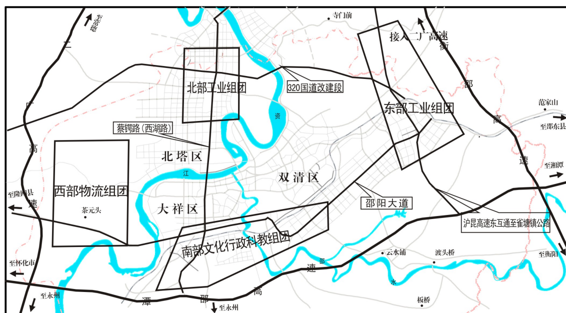
邵阳市“十二五”中心城区发展布局图

部物流组团,在城区西郊茶元头和陈家桥周边打造全市物流中心。以“四组团”建设加快拓展城市规模,提升经济和社会发 展水平。